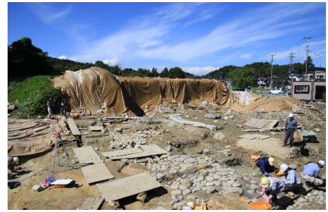
町内遺跡の発掘調査