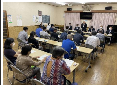
町民と対話する地域懇談会