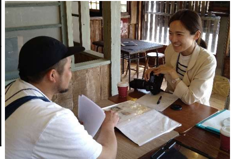
国際交流員 (CIR: 写真右) の活動