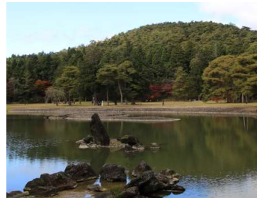
特別名勝 毛越寺庭園