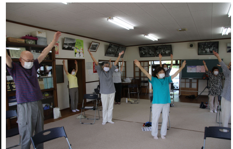
いきいき百歳体操