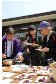
平泉駅前でのもち振舞い