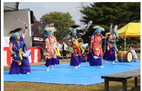
産業まつりで神楽を披露する中学生