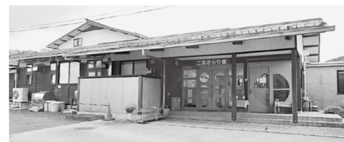
コロナ過の中でも頑張る保育所・幼稚園

町長 夏季における感染症対策として、空調機を設置し教育環境の整備を図ったところである。さらに、水道の蛇口の水栓自動化を行った。