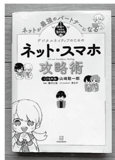
インターネットを使いこなすために読んで欲しい本

教育長 タブレット端末の授業導入でタブレットを使う時間は限られる。そのための視力低下やブルーライトの影響は心配していない。むしろ家庭でのスマホの長時間使用などが健康被害につながると思っている。