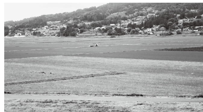
主食用米から転作する大規模農地

町長 夏季における感染症対策として、空調機を設置し教育環境の整備を図ったところである。さらに、水道の蛇口の水栓自動化を行った。