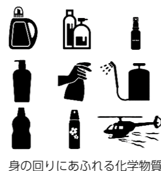
身の回りにあふれる化学物質

教育長 化学物質に過敏に反応する児童生徒が潜在的に存在することを念頭に、洗剤の使用回数を減らすなど、対応を行っている学校もある。また、給食着など、柔軟剤や芳香剤の過剰