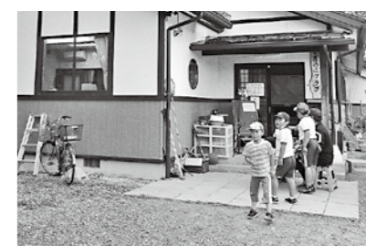
大人数となった放課後児童クラブ

町長 国の放課後児童健全育成事業の一部改正により、事業に従事する人数などの設備運営基準が「参酌すべき基準」