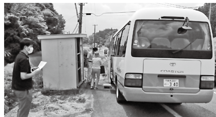
新型コロナワクチン接種の送迎バス

に対しては、1日150回以上接種する医療機関は補償が増額する内容である。当町もこれに準じた対応が医療機関