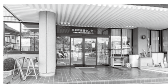
生命を守る保健センター

問 チェックシートを風呂に貼っておけば毎日自分でチェックし、早期発見に役立つ物と考えるが