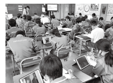
タブレットを使った平中の授業スナップ