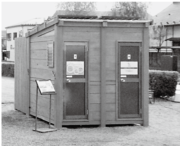
上下水道がいない完全循環型エコまるトイレ

答 まちづくり推進課長 エコまる技術は海外からも注目され、世界唯一のシステムと言われており、地域産業活性化に繋がるものである。