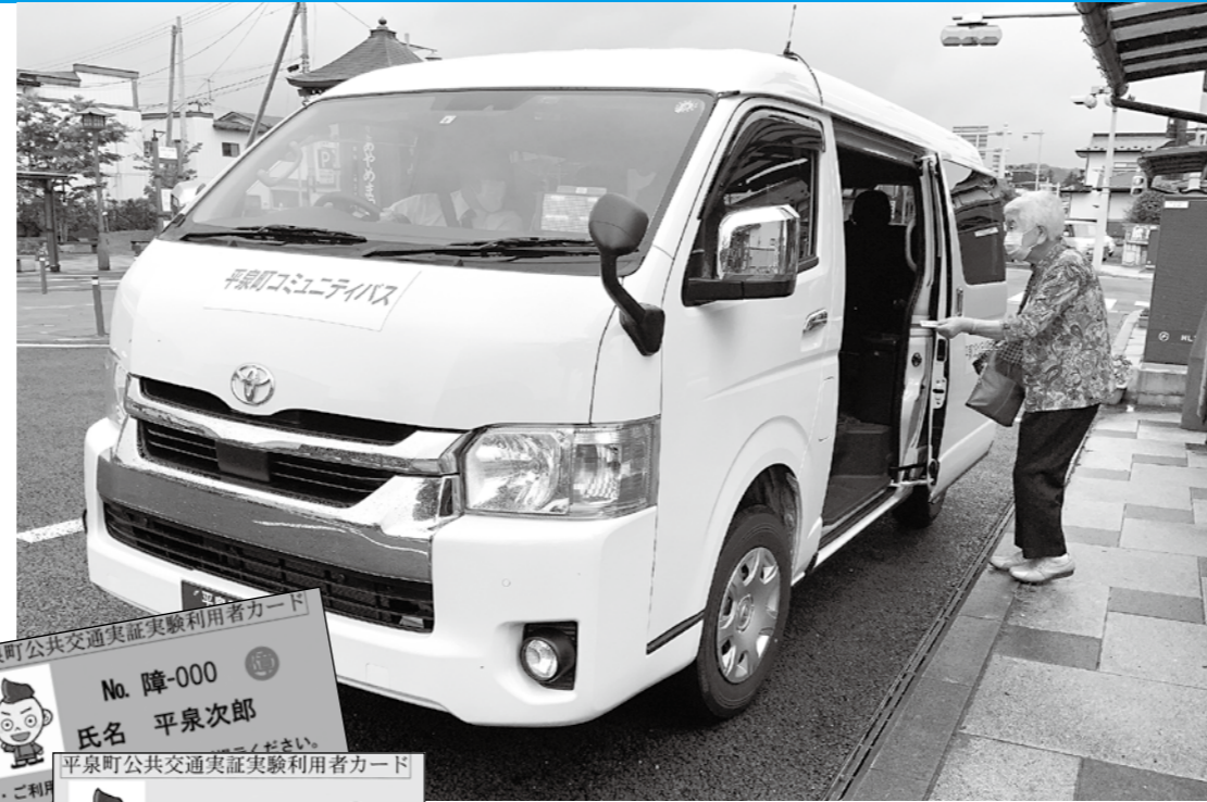
乗車には利用者カードが必要です

答 現状では、利用登録を済ませなければ乗車することができないが、申し込みが電話でも簡単に行えることを今後も周知していく。町外の方は利用することができない。