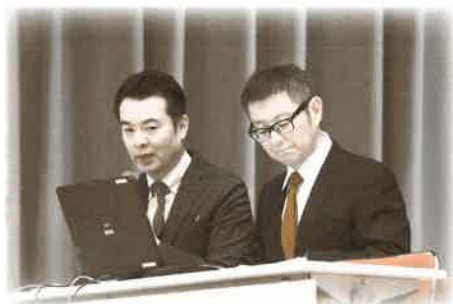
平泉中学校PTAの発表