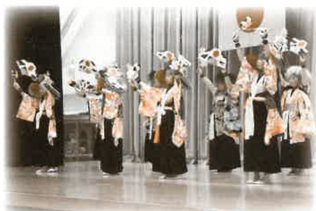
郷土芸能体験講座の神楽