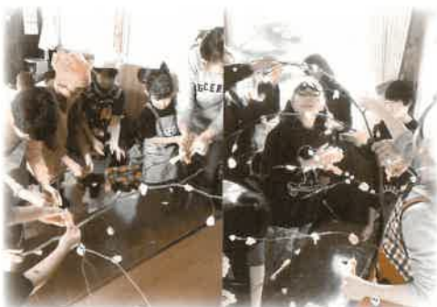
[6・7区] 餅つき、餅花飾り体験