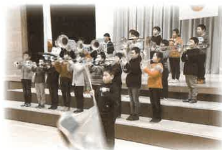
長島小学校マーチング