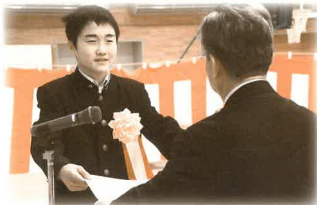
平泉中学校吹奏楽部

ライオンズクラブ国際協会 332複合地区(東北地区)ガバナー協議会 2018～2019年度国際平和ポスターコンテスト 「優秀賞」受賞