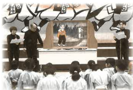
人形劇 どんぐりのジャンボ紙芝居