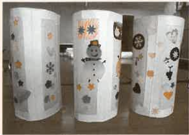
今日の活動は「ゆめあかり」を作ります！