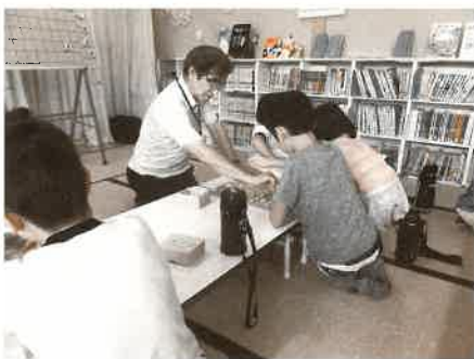
将棋の指し方を指導しているボランティアさん