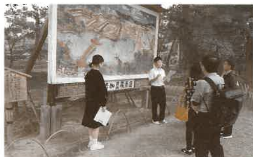
自分たちのことばで平泉の魅力発信！

10月6日、3年生60名は中学校3年間で積み上げてきた「郷土・平泉学」の集大成となるガイド体験を行いました。1年生のわくわく平泉体験学習、2年生の防災学習、3年生の平泉アピール活動など3年間を通した「郷土・平泉学」は、行政、学校、保護者、地域の様々な事業所や諸団体の方々のご協力をいただきながら、郷土に誇りをもち、将来を担っていく心を育む活動となっています。