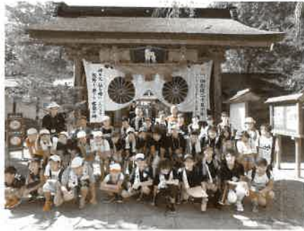
熊野本宮大社前で、参加者全員で撮影。田辺の友達もできました。