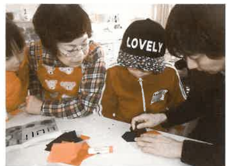
カラフルなおりがみで作り方を教えてくれるボランティアさん