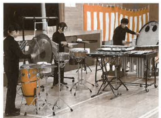
昨年度の平泉中学校生徒による成果発表 打楽器3重奏 ラプソディーⅢ - 凜