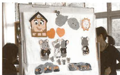
パネルシアター「ねずみのよめいり」

本校では、読書活動について様々な取り組みを工夫しています。図書ボランティアさんには、楽しい読み聞かせや図書室の装飾、図書の紹介をしていただいています。また、図書委員会の児童も図書祭りの活動として「2冊貸出券」を発行したり、新しい本を探すゲームなどを行ったりするなど、図書室を訪れたいくなるような企画をしました。自然に本に親しむことができる環境が整っていることは素晴らしいです。