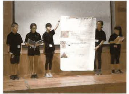
前の晩まで練習した平泉のPR。とてもうまくいきました。