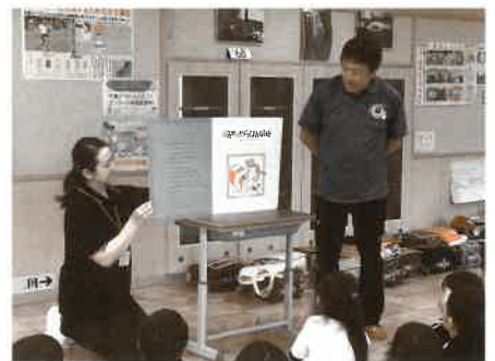
お父さんによる絵本の読み聞かせ活動も平泉にはあります