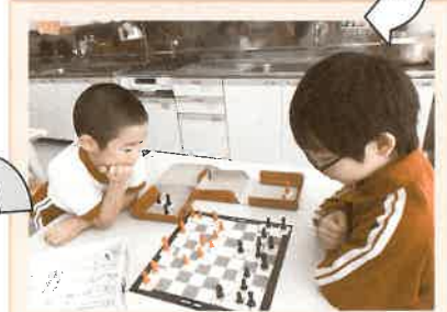
作る作らないは自由。遊び方もさまざまです