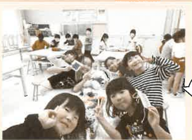
子どもたちの笑顔がいっぱいの「わくわくフィールド」