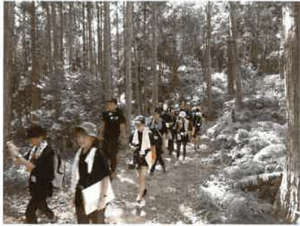
世界遺産「熊野古道」約5kmを現地児童の語り部ガイドと歩きました。

町教育委員会が主催する町内の小学5・6年生を対象にした「黄金平泉情報発信プロジェクト」の活動が8月1日から3泊4日の日程で開催し、団員15人が和歌山県田辺市へ児童交流と歴史学習そして平泉のPR活動を行ってきました。