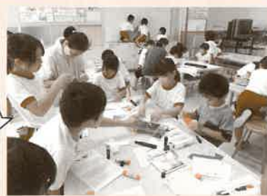
ボランティアの方に教えてもらいながら作ります