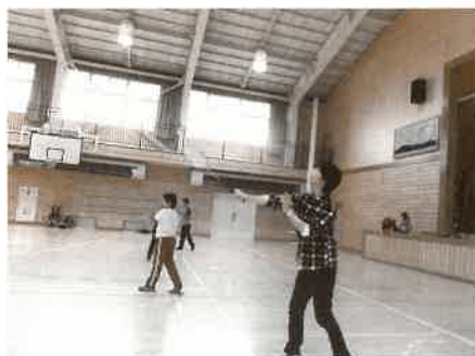
放課後子ども教室では、子ども達と一緒に遊びます