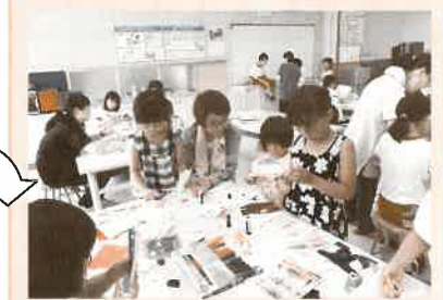
とても暑い日でしたが集中して取り組んでいます