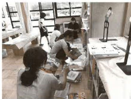
図書ボランティアの手で図書館が明るく彩られていきます