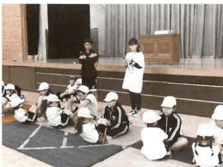
体育の授業で体力測定の計測をするボランティアさん