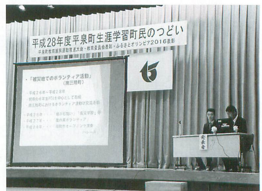
昨年度の長島小学校実践区による教育振興運動実践活動発表の様子