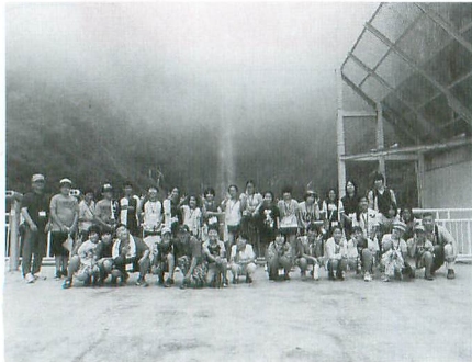
日光「華厳の滝」の迫力と壮大さにみんな感激！

町教育委員会が主催する町内の小学5・6年生を対象にした「ジュニア平泉文化歴訪団」の活動が8月2日から2泊3日の日程で開催され、団員30人が栃木県日光市の世界遺産「日光」と平泉の歴史にゆかりの深い福島県白河市・国見町を訪れて、歴史学習を行いました。