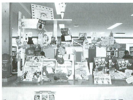
図書ボランティアの手で明るく彩られた学校図書室の入口