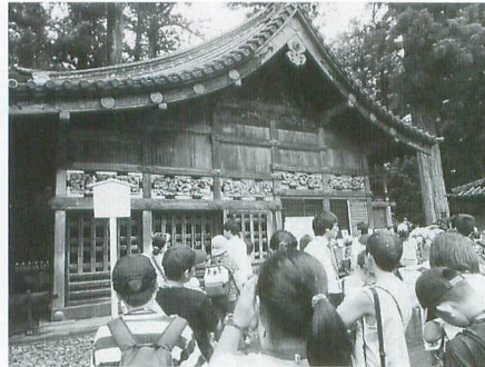
日光東照宮の三猿を見ながら、日光の歴史を詳しく学習しました