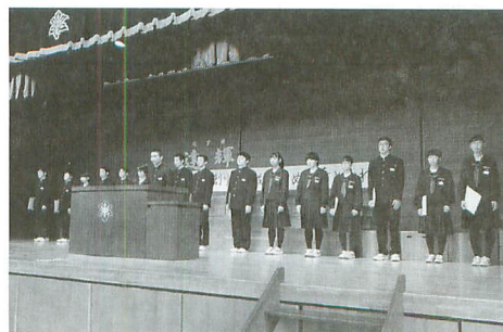
生活向上の諸運動も進めます