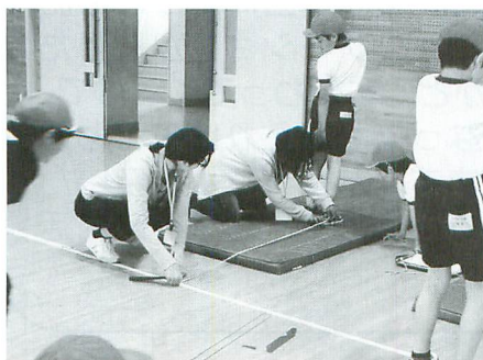
体育の授業で子ども達の体力測定の計測するボランティア