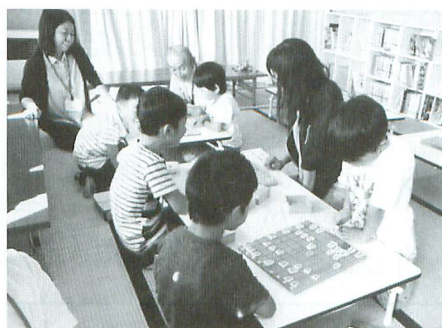
放課後子ども教室では、子ども達と一緒に将棋で遊びます