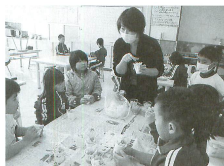
カラフルな平泉キャンドルの作り方を教えてくれるボランティア