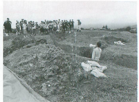
頼朝軍を迎え撃った国見の阿津賀志山防塁の高低差にびっくり！