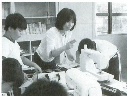
家庭科の授業でミシンの使い方を教える授業補助のボランティア